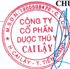
Đào Mạnh Lương