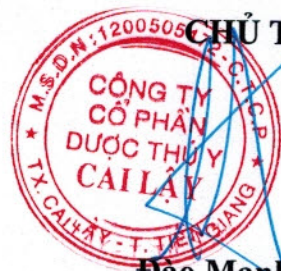
Đào Mạnh Lương