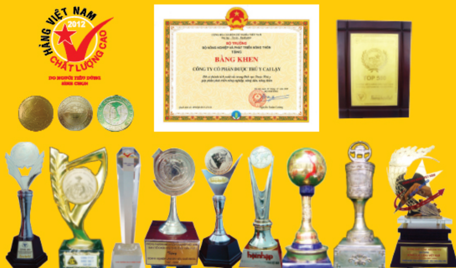
Hình ảnh một số thành tựu đạt được.

Đặc biệt năm 2020, Công ty Cổ phần Dược Thú y Cai lậy vinh dự nhận được bằng khen của Bộ Nông nghiệp &PTNT với Danh hiệu Công ty có thành tích xuất sắc trong lĩnh vực Dược Thú y, góp phần phát triển nông nghiệp, nông thôn, nông dân.